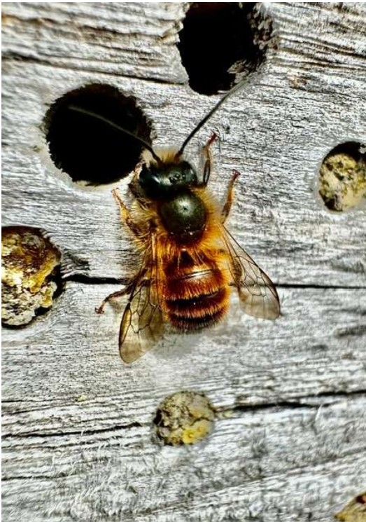
Metselbijtje in ons eco-buurtje