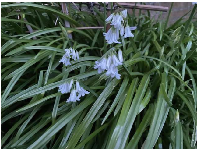
Driekantig look in de tuin

De kaarten kosten (vanaf 21 jaar) 20 Euro en zijn inclusief een drankje. Voor tickets zie verder: Tickets - Taborconcerten